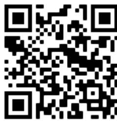
Nummer gg. Kummer